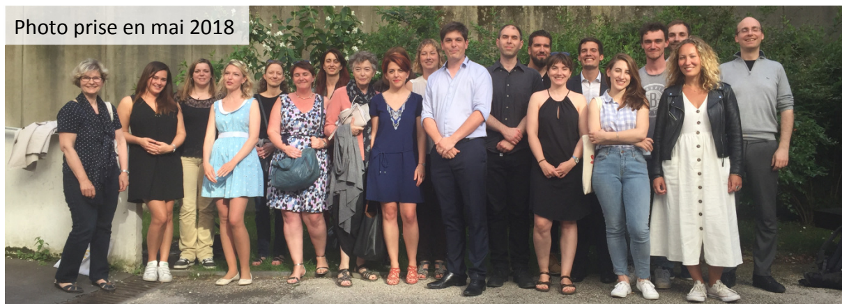
Photo prise en mai 2018

L'association regroupe de nombreuses personnes issues d'une AMP avec donneur, ainsi que des parents ayant bénéficié d'un don et des donneurs de gamètes. C'est une association à but non lucratif, totalement indépendante (financée exclusivement par ses adhérents), apolitique, n'appartenant à aucun courant religieux et qui compte actuellement environ 300 membres.